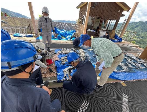
《索道メーカーと共同による年次点検》