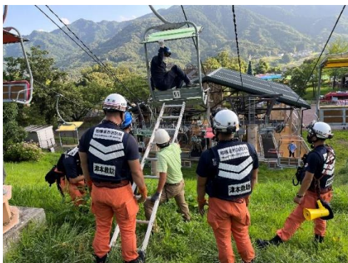
《消防署合同のリフト救助訓練》