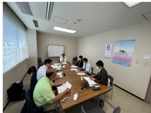
《索道グループ安全会議の実施》