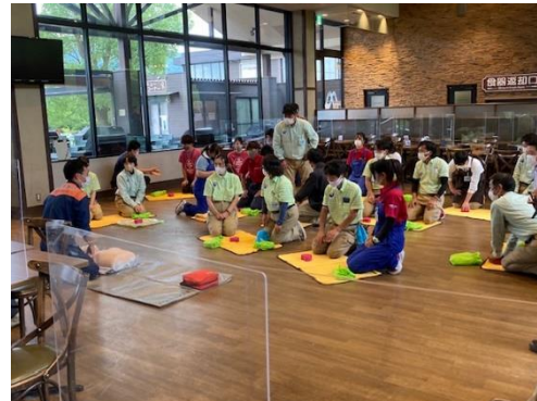
《消防署合同の救命救助訓練》